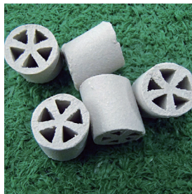
磁器質異形担体 (Φ10×10・5穴)