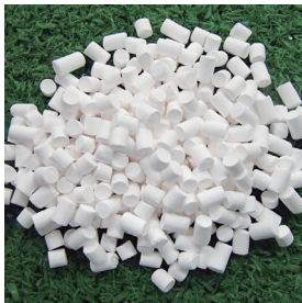
アルミナペレット (Φ3×3)