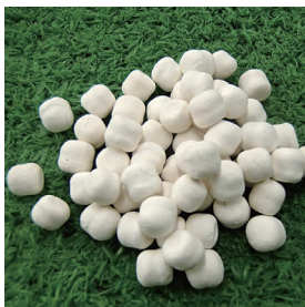
シリカペレット (Φ5×5: マルメ加工)